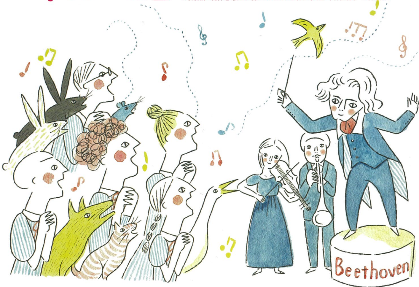
イラスト：平野聖子

ベートーヴェン： 交響曲 第9番 二短調 作品125 <合唱付> ※演奏前に指揮者 秋山和慶によるおはなし付き（司会 中井美穂） ※休憩あり