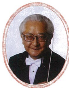
秋山和慶 (指揮・おはなし)